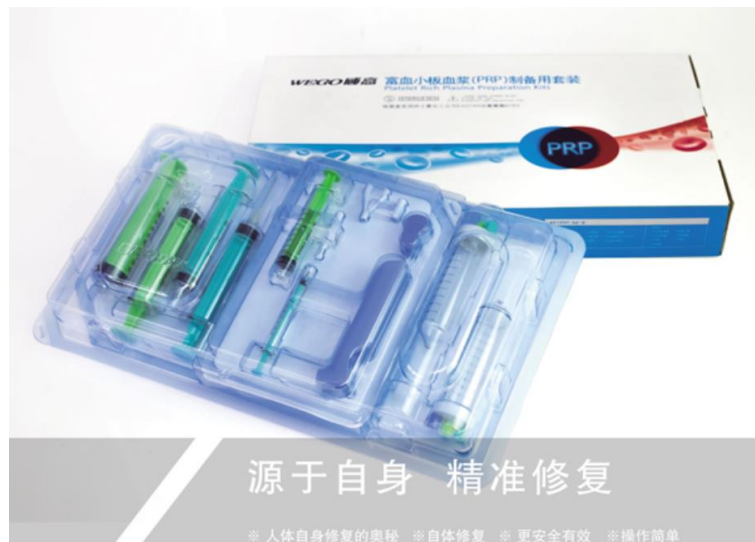
图 1 富血小板血浆（PRP）制备用套装产品示意图

富血小板血浆（PRP）制备用套装为第三类医疗器械，经过国家药品监督管理局注册审批上市。