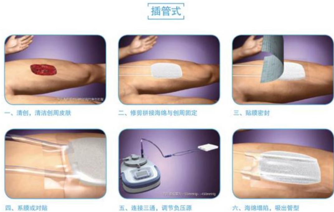
图 4 封闭创伤负压引流套制备过程